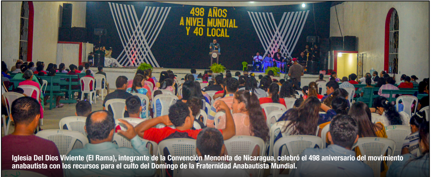
Iglesia Del Dios Viviente (El Rama), integrante de la Convención Menonita de Nicaragua, celebró el 498 aniversario del movimiento anabautista con los recursos para el culto del Domingo de la Fraternidad Anabautista Mundial.