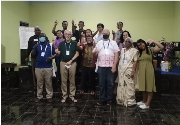
La congregación GITJ de Margokerto, una de las primeras iglesias menonitas en la región de Muria, recibió a invitados del CMM en la 17ª Asamblea en Indonesia.

Mientras duró el conflicto, muchas personas de las iglesias anhelaban la reconciliación.