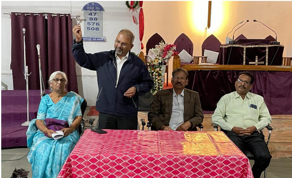
Una conferencia regional de una iglesia en India.