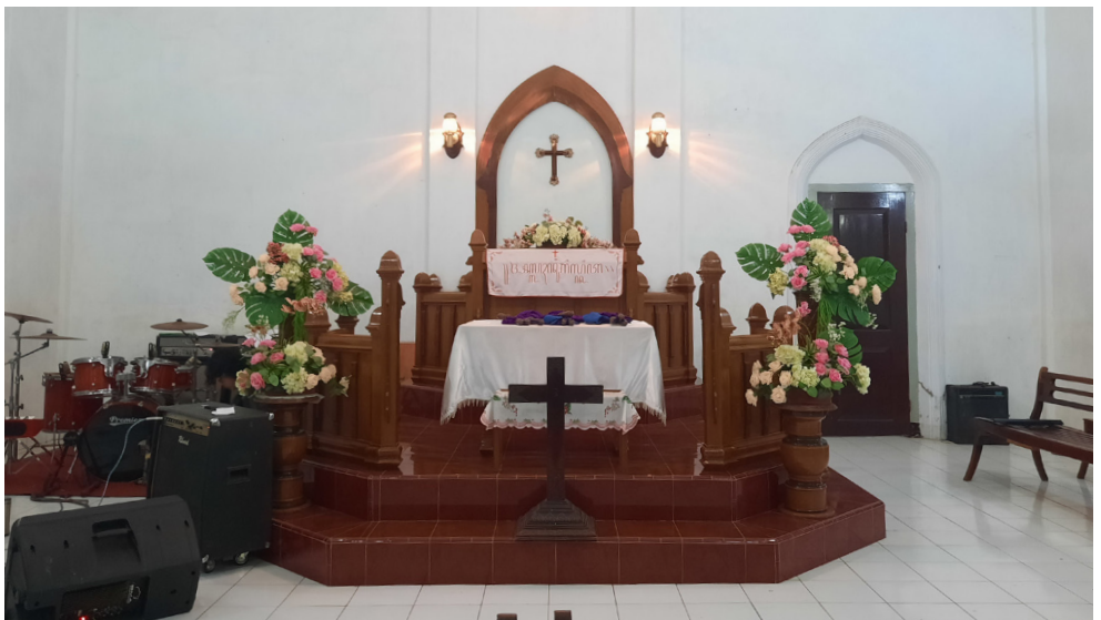
GITJ Kelet, Jepara, Indonesia, está decorada al estilo javanés.