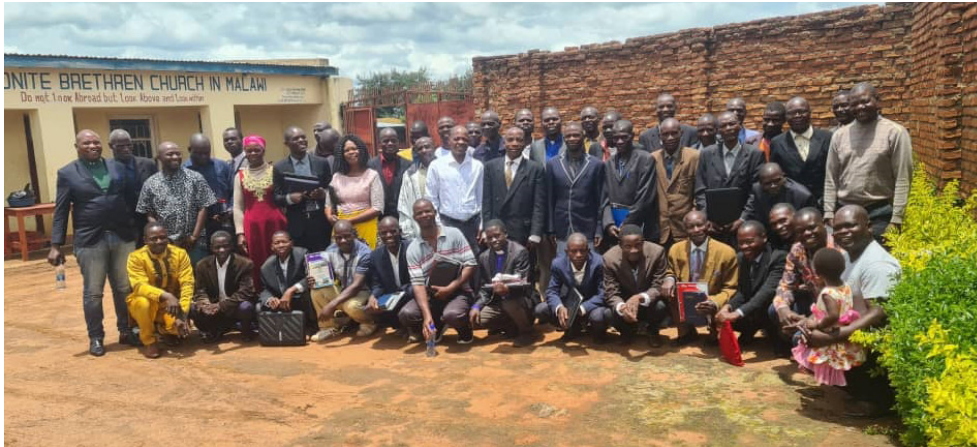
Líderes en la convención general anual de MBCM.