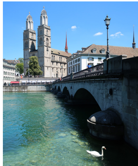
La Catedral de Grossmünster en Zúrich, Suiza.

Consulte el sitio web del CMM para obtener información actualizada sobre la conmemoración del quinientenario.