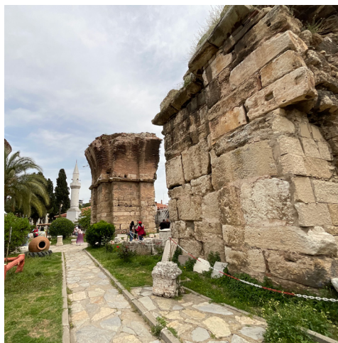
Ruinas de la Iglesia de San Juan, Alaşehir (anteriormente Filadelfia), Turquía.

Bernabé quería llevar con ellos a Juan, también llamado Marcos. Pero a Pablo no le pareció conveniente llevar a quien los había abandonado en Panfilia y no los había acompañado en la labor. Fue tan serio el