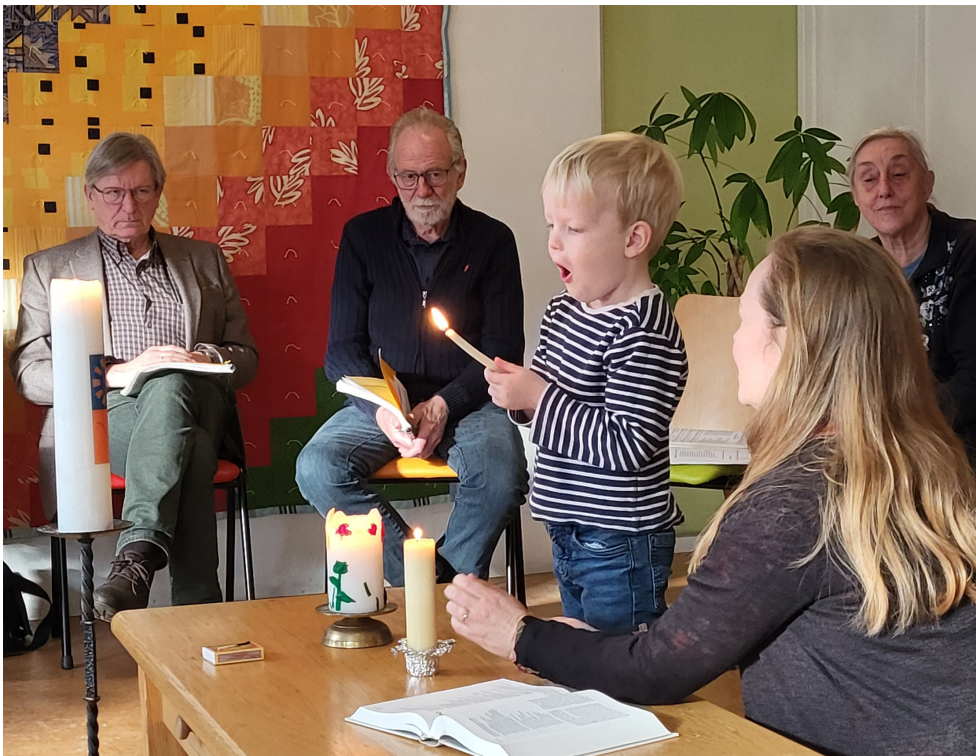
Una reunión de la Iglesia Menonita de Naarden Bussum, Países Bajos.