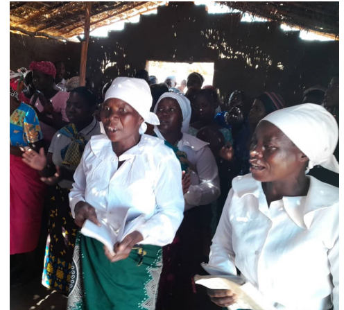
Miembros del coro en una convención general anual de la iglesia BIC.