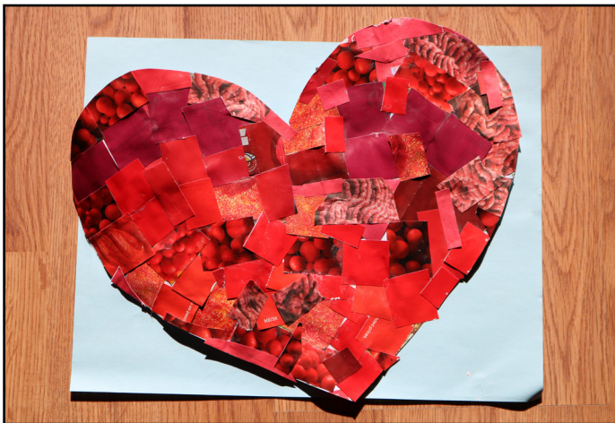
Ce cœur en mosaïque est composé de nombreux petits morceaux différents, tout comme l'Église.