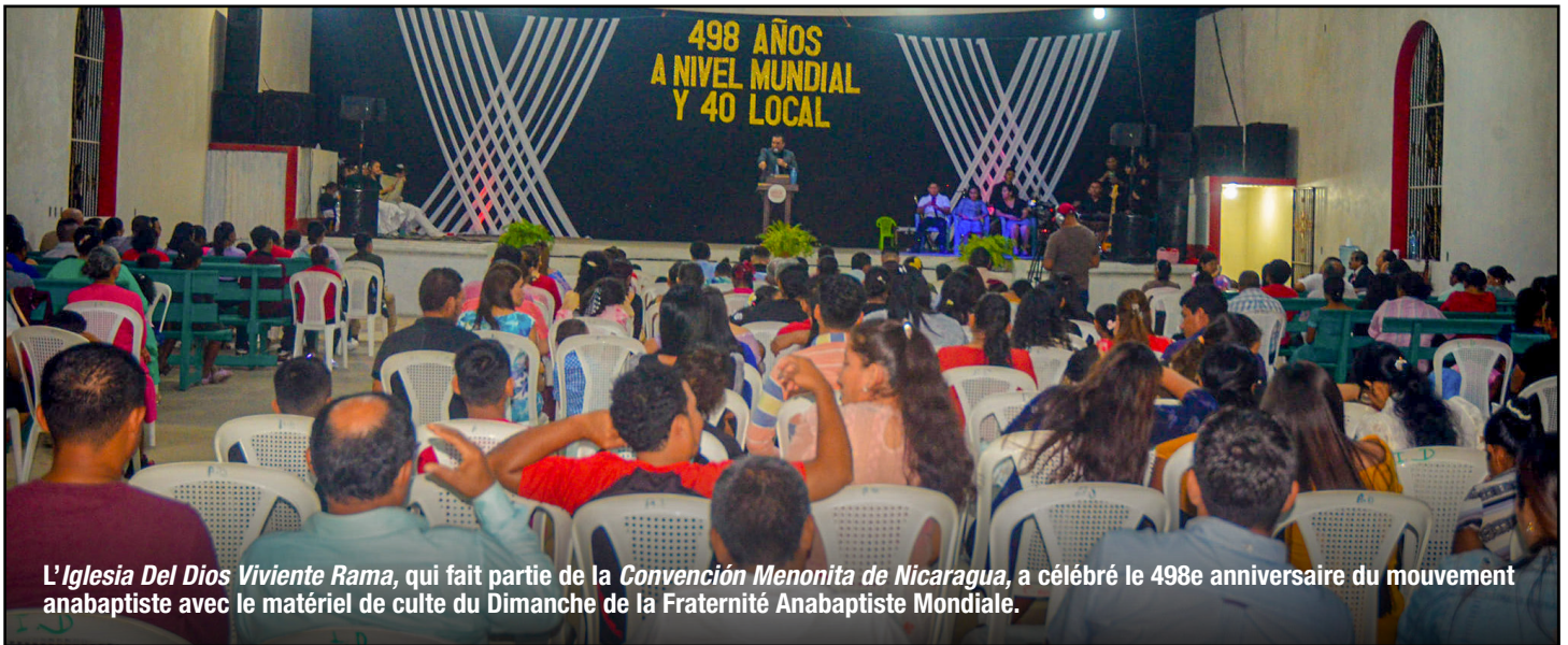
L'Iglesia Del Dios Viviente Rama, qui fait partie de la Convención Menonita de Nicaragua, a célébré le 498e anniversaire du mouvement anabaptiste avec le matériel de culte du Dimanche de la Fraternité Anabaptiste Mondiale.