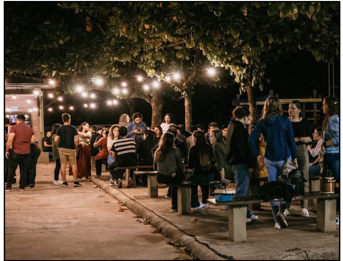
Iglesia Menonita Concordia