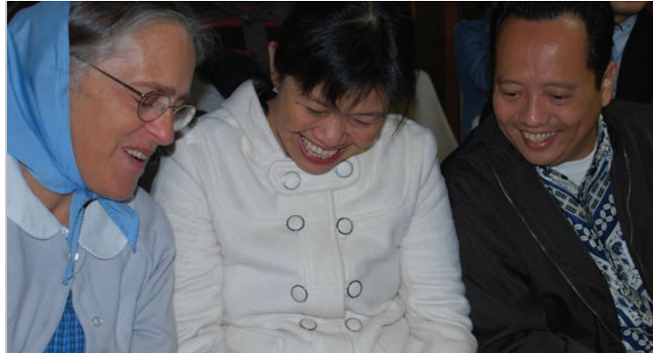
Pennsylvania 2015 brindará a los anabautistas de todo el mundo la oportunidad inigualable para confraternizar y adorar en un ámbito intercultural.