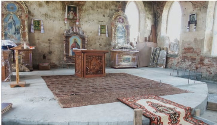
El santuario parcialmente restaurado de la Iglesia Menonita Schoensee, actualmente una iglesia católica griega.

Este acontecimiento, según observadores, es un ejemplo de la colaboración menonita-católica conforme al espíritu de otros intercambios durante la década pasada.